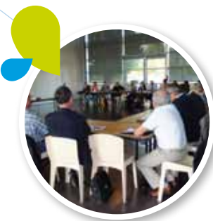
▲ Réunion de la Commission locale de l'eau du SAGE Vienne