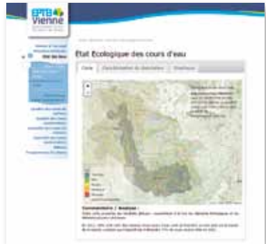
L'Observatoire de l'eau du bassin de la Vienne a été mis en ligne en 2015

Cet observatoire s'adresse à tout public intéressé par la connaissance de la ressource en eau ; mais plus spécifiquement aux aménageurs et porteurs de projets.