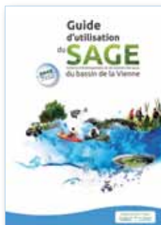
Le Guide du Sage révisé a été publié en 2013

Il porte également des études pour améliorer la connaissance. L'EPTB Vienne a ainsi acquis une expérience sur la mise en œuvre et l'application de SAGE. Aussi, le développement de ce mode de gestion à d'autres territoires tels que la Vienne Tourangelle ou la Creuse est à l'étude.