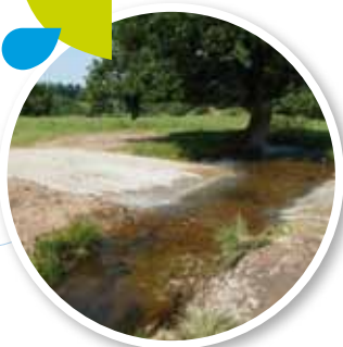
▼ Aménagement d'un passage à gué (SMMB)