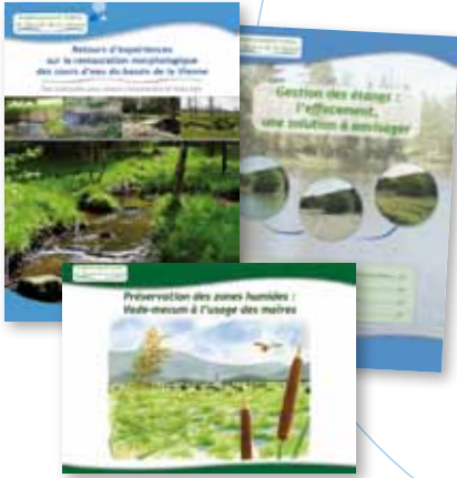
▲ Documents de communication édités par l'EPTB