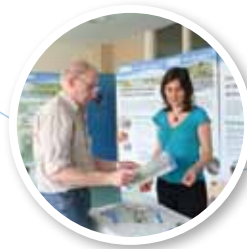
◀ Stand de l'EPTB lors d'un colloque

Un accompagnement des acteurs du bassin dans leurs projets de communication est également proposé.