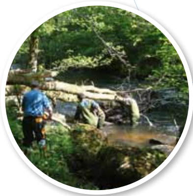
▲ Enlèvement d'embâcles