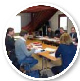
◀ Réunion du comité syndical