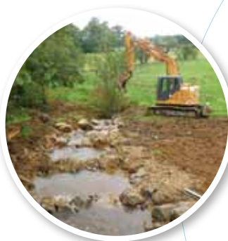
Construction d'une passe à poissons (SMMB) ▼

En 2015, les contrats territoriaux couvrent 75% du bassin de la Vienne.