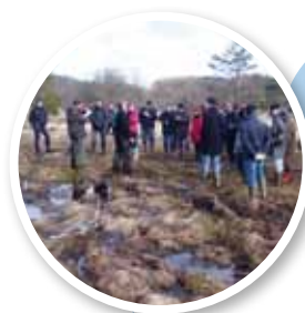
▲ Partage d'expériences

Une équipe de 7 agents assure les missions de l'EPTB Vienne.