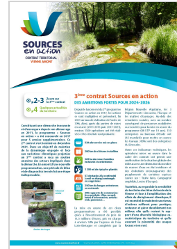
Lettre d'information Sources en Action

EPTB Vienne 20 rue Atlantis - Parc ester Technopole 87068 Limoges Cedex contact@eptb-vienne.fr