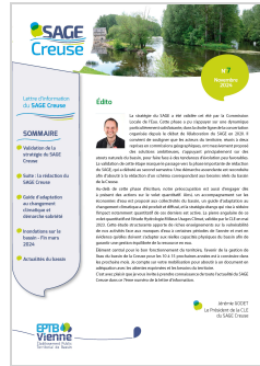
Lettre d'information n°7 du SAGE Creuse