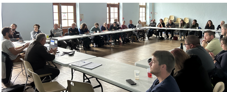
Commission géographique Creuse amont - 14.05.2024 - Sardent

Concernant le SAGE Creuse , l'architecture du Plan d'Aménagement et de Gestion Durable (PAGD) a été présentée lors de la CLE du 14 novembre. Après l'organisation, en novembre/décembre, de commissions thématiques visant à alimenter les futures dispositions, la formalisation du PAGD sera entreprise au premier trimestre 2025.