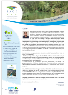
Lettre d'information n°3 du SAGE Clair

Au cours des derniers mois, plusieurs documents ont été produits dans le cadre de l'activité de l'établissement et sont disponibles sur notre site internet EPTB Vienne .