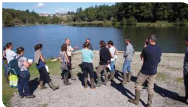
Formation sur la gestion des étangs

En 2015, l'accompagnement des structures souhaitant intégrer un volet étangs dans des contrats territoriaux est renforcé avec notamment la réalisation d'un guide spécifique. Des journées techniques seront également organisées afin de compléter les connaissances acquises lors des formations.