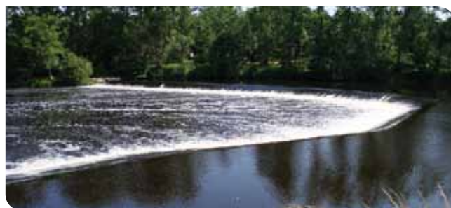
Seuil de Lamirande sur la Vienne

Afin de dynamiser la restauration de la continuité écologique, cette étude s'inscrit dans une démarche consistant à établir un conventionnement entre les propriétaires d'ouvrages et les producteurs d'hydroélectricité cherchant des ouvrages à effacer en contre partie du développement de leur activité conformément aux objectifs du SAGE.