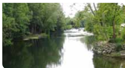
Le Clain à Naintré

Ces derniers mois ont été consacrés à l'élaboration des scénarios alternatifs. 3 commissions thématiques se sont tenues fin 2014 : Qualité, Quantité et