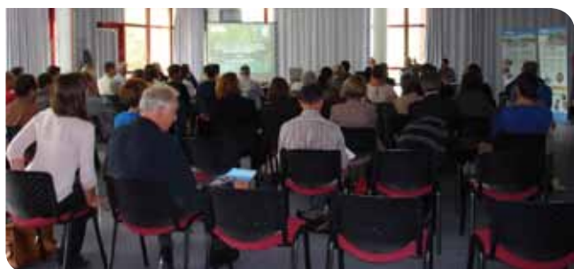
Réunion du 17 octobre 2014

Le projet de Loi NOTRe (Nouvelle Organisation Territoriale de la République), en cours de préparation fait également l'objet d'un suivi attentif. L'organisation du partage des compétences entre collectivités et une modification du seuil démographique pour les communautés de communes pourraient avoir des répercussions sur l'organisation de la compétence GEMAPI.