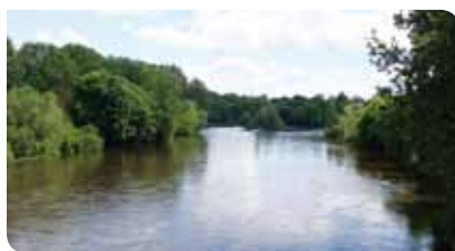
La Vienne à Civaux

d'ouvrages (collectivités, associations, chambres consulaires). Il porte également des actions dans le domaine agricole.