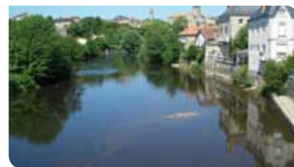
La Gartempe à Montmorillon