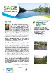
Lettre n°17 du SAGE Vienne