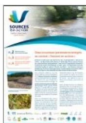
Lettre n°6 du programme Sources en action