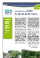
Lettre n°3 du SAGE Creuse