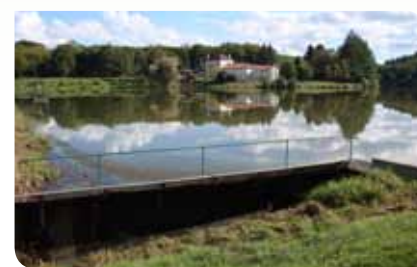
Étang de Rochechouart réaménagé

L'étang appartient au propriétaire du terrain submergé. Il a la possibilité d'en interdire l'accès, mais doit cependant respecter le bail de pêche s'il en a conclu un.