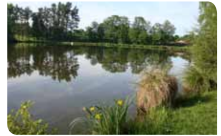
Un plan d'eau à Etagnac (16)

Un plan d'eau fait toujours partie d'un bassin versant qu'il soit directement situé sur un cours d'eau ou non. Son fonctionnement, la nature et la qualité de son eau, de sa flore et de sa faune dépendent de ce bassin versant. De même, le plan d'eau, par sa simple existence et les activités qui y sont réalisées, a une influence sur l'aval. Il existe donc un enjeu à appliquer une bonne gestion de l'étang pour préserver la bonne santé des milieux aquatiques, mais également pour préserver son bon fonctionnement.