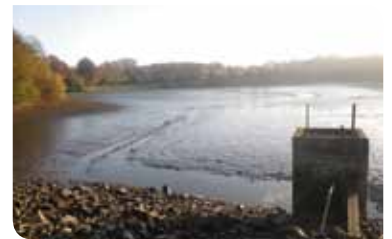
Remplissage d'un plan d'eau après vidange ©FDAAPPMA 87