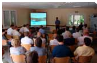
Inauguration du Syndicat le 17/09/18

Le Syndicat Mixte du bassin de la Petite Creuse a ainsi été créé en avril 2018 pour exercer la compétence en mettant logiquement en œuvre le Contrat Territorial de la Petite Creuse actuellement en cours.