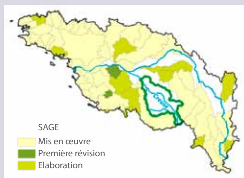
Le SAGE, un outil développé sur l'ensemble du bassin Loire-Bretagne

Un Schéma d'Aménagement et de Gestion des Eaux est un outil de planification en faveur d'une gestion durable de l'eau doté d'une portée juridique. Elaboré de manière concertée au niveau local, il organise une gestion globale et équilibrée de l'eau dans l'intérêt général.